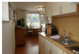
Die Küchenzeile vom Schlafzimmer aus Richtung Wohnzimmer.