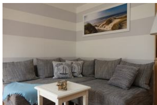
Kommen Sie herein und nehmen Sie Platz auf der gemütlichen Couch

Auf einem ca. 3000qm großen Grundstück zwischen Boldixumer Str. und Umgehungsstrasse können wir Ihnen 4 Ferienwohnungen für 2-5 Personen anbieten. Die Wohnung 3 - ein kleiner Bungalow mit ca. 33qm ist für zwei Personen eingerichtet. Wohnraum, offene Küchenzeile, Schlafzimmer und Duschbad, alles hat seinen Platz gefunden. Zudem eine herrliche Terrasse auf der Sie in der Morgensonne frühstücken können.