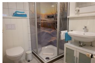
...die Dusche, niedrige Duschwanne