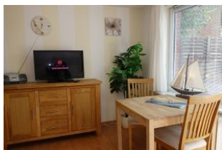
Der Esstisch mit Blick in den Garten. Das TV Gerät