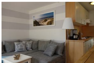
Die Couch, rechts im Bild die Küchenzeile