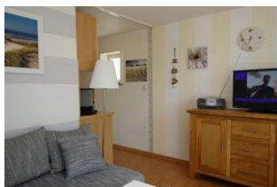
Der Durchgang führt zu Schlafzimmer und Bad