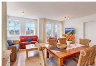
Essplatz und Blick zu Wohnbereich und Balkon