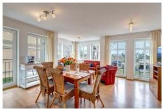
Essplatz und Blick zum Wohnbereich

1. Reihe, direkt an der Strandpromenade mit SEEBLICK und FAHRSTUHL im Haus! Geräumiges und geschmackvoll eingerichtetes 3-Zimmer-Apartment mit moderner guter Ausstattung. Zwei separate Schlafzimmer (eines davon mit 2. Fernseher), Wohnzimmer mit Küchenzeile und Essplatz, Bad mit Wanne und Dusche, Gäste-WC, Balkon zur Seeseite mit ausschnittweisem Seeblick, zus. ein kleiner Balkon neben der Küche. Küchenzeile zusätzlich mit Espressomaschine, Wasserkocher, Eierkocher, Mixer, elektr. Zitruspresse. Die Wohnung verfügt über einen Tiefgaragen-Pkw-Stellplatz. Von der "Villa Aquamarina" aus können Sie das Ortszentrum und die bekannte Ahlbecker Seebücke in ca. 3 Minuten zu Fuß erreichen. Zum Strand sind es 50 m.