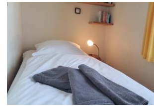
Schlafzimmer mit Einzelbett