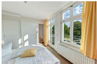
Wohnbereich, Blick in das Schlafzimmer mit Empore

STRANDNAH mit SÜDBALKON! Nur ca. 100 m zur Strandpromenade! Schönes gemütliches Maisonette-Apartment mit 2 Zimmern und zus. Schlafrum auf der Empore, gute Ausstattung. Separates Schlafzimmer, zus. Maisonette-Schlafrum, Wohnzimmer mit Küchenzeile und Essplatz, Duschbad, Südbalkon. Die Wohnung verfügt über einen Pkw-Stellplatz. Abstellraum für Fahrräder und ähnliches ist vorhanden. Eine Sauna in der "Villa Germania" kann kostenpflichtig genutzt werden. Vom Haus aus können Sie das Ortszentrum und die bekannte Ahlbecker Seebrücke in ca. 3 bzw. 5 Minuten zu Fuß erreichen.