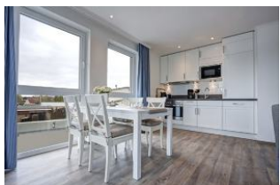
Essplatz und Küche