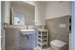
separates Gäste WC