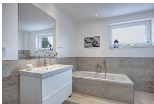
Badezimmer mit Dusche und Wanne