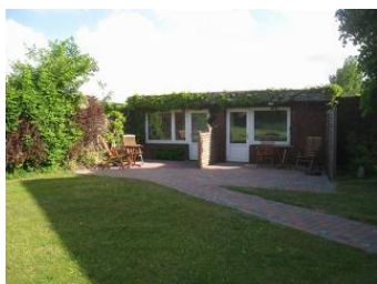
2 Bungalows bei Familie Carstensen, der rechte Eingang führt in die Wohnung 3