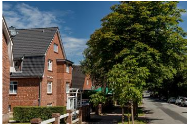
Die Unterkunft befindet sich im 2. OG (Hochparterre).