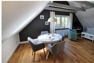
Ihr heller und lichtdurchfluteter Essbereich...