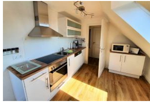
Die helle Küchenzeile ist gut ausgestattet. Hier lassen sich leckere Mahlzeiten zubereiten.