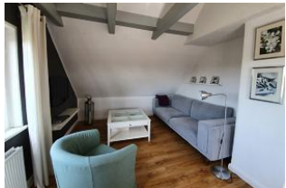
Das großzügige und modern eingerichtete Wohnzimmer für gemeinsame Urlaubsstunden.

Herzlich willkommen im "Haus zur See". Mit ihrer hellen und modernen Einrichtung, sowie auch der schönen Aussicht aus dem 2. OG bietet die Dachgeschosswohnung den geeigneten Platz um Ihre Urlaubstage zu genießen. Der beliebte Südstrand ist weniger als 300 m entfernt. In der gleichen Entfernung finden Sie auch einen kleinen Supermarkt, einen Bäcker und zahlreiche Restaurants. Sollten sie trotz der kurzen Wege nicht auf Ihren PKW verzichten wollen können Sie gerne die hauseigene Stellplätze nutzen.