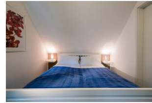
Das gemütliche Schlafzimmer mit Doppelbett.