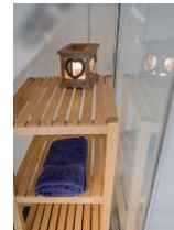
... und viel Ablageplatz.