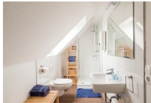
Das helle Duschbad mit Tageslicht ...