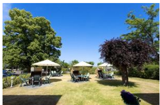
Garten mit Terrassen und Strandkörben (Mai bis September)