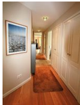
Aus dem hellen Flur erreichen Sie jedes Zimmer