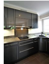
... ist hochwertig eingerichtet