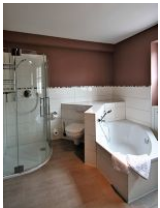
... mit Dusche und Badewanne