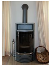
Der schöne Kaminofen für kuschelige Abende