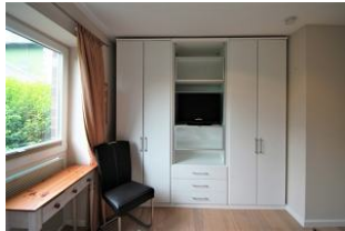
... und großem Kleiderschrank