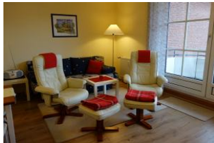
Das neue Wohnzimmer mit Laminatboden.

Sie suchen Entspannung ? Relaxstuhl heißt das Zauberwort. Diese bieten wir Ihnen in einer gepflegten Zwei - Zimmer - Wohnung unweit vom Wyker Südstrand an. Die kleine Küche und das Wohnzimmer mit Austritt auf den Balkon sind komfortabel ausgestattet. Das Duschbad verfügt über eine hohe Duschwanne. Das Schlafzimmer mit großem Doppelbett ist gemütlich eingerichtet.