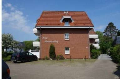
Die Aussenansicht des Hauses Meeresbrandung Gmelinstr. 12 in Wyk