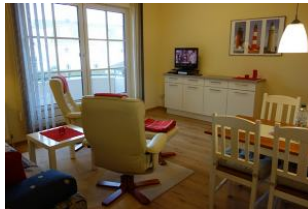
Zwei Relaxstuhl zum Fernsehen, entspannen, lesen ....