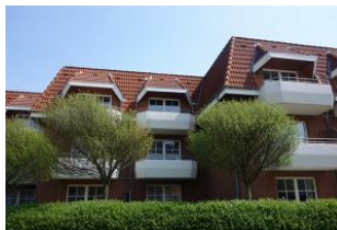
Der Balkon liegt etwas zurück