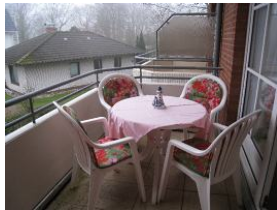
Und der herrliche Balkon.....