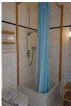
Noch einmal die Dusche mit hoher Wanne !