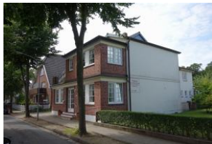
Das Haus Hallig Hooge von der Seite, früher war das Haus eine Pension