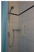
Die Dusche mit Haltegriff.