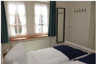
Im Schlafzimmer ein großer Spiegel