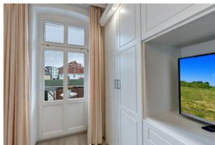
Flachbildfernseher im Schlafzimmer