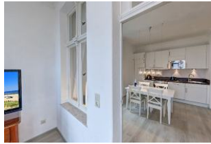
Blick in die Wohnküche