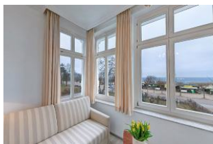
Blick aus Veranda