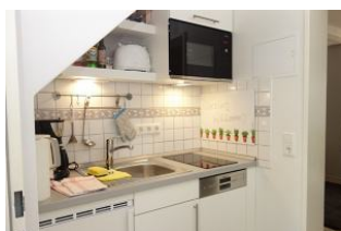
Die kleine Küchenzeile mit Geschirrspüler und Mikrowelle

Ruhig gelegen, inmitten unseres kleinen Städtchens Wyk finden Sie unser Haus Hallig Hooge, welches insgesamt 7 Wohnungen für jeweils zwei Personen beherbergt. Das Appartement Langeneß ist größer als die anderen Erdgeschossappartements und bietet daher ein wenig mehr Freiraum. In dem großzügigen Wohnraum mit Essplatz, der kleinen Einbauküche, dem Schlafzimmer mit Einzelbetten, und dem Duschbad kann man auch einen längeren Aufenthalt genießen, ohne sich eingeeengt zu fühlen. Ein großer Kleiderschrank im Flur vor dem Schlafzimmer bietet genügend Platz für Garderobe.