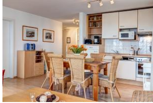
Küchenzeile und Essplatz