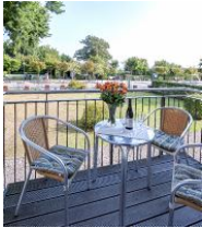
Balkon im Sommer