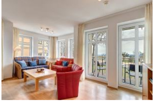
Wohnbereich und Blick Richtung Meer