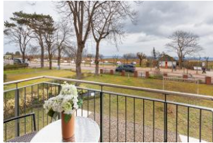
Balkon im Winter