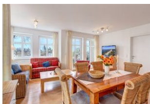
Essplatz und Blick zu Wohnbereich und Balkon