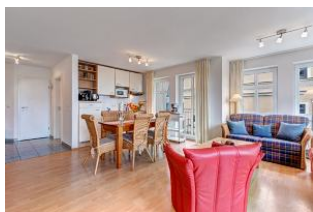
Wohnen und Essen