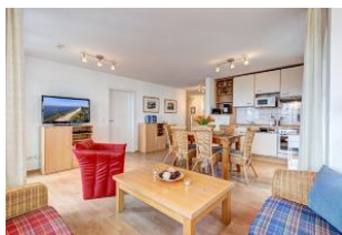
Wohnen und Essen