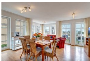
Essplatz und Blick zum Wohnbereich

1. Reihe, direkt an der Strandpromenade mit SEEBLICK und FAHRSTUHL im Haus! Geräumiges und geschmackvoll eingerichtetes 3-Zimmer-Apartment mit moderner guter Ausstattung. Zwei separate Schlafzimmer (eines davon mit 2. Fernseher), Wohnzimmer mit Küchenzeile und Essplatz, Bad mit Wanne und Dusche, Gäste-WC, Balkon zur Seeseite mit ausschnittweisem Seeblick, zus. ein kleiner Balkon neben der Küche. Küchenzeile zusätzlich mit Espressomaschine, Wasserkocher, Eierkocher, Mixer, elektr. Zitruspresse. Die Wohnung verfügt über einen Tiefgaragen-Pkw-Stellplatz. Von der "Villa Aquamarina" aus können Sie das Ortszentrum und die bekannte Ahlbecker Seebücke in ca. 3 Minuten zu Fuß erreichen. Zum Strand sind es 50 m.