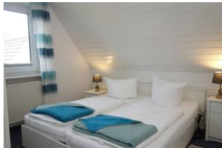
Das große Doppelbett misst 180x200cm ohne Fußteil