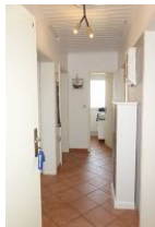
Treten Sie ein...herzlich Willkommen!