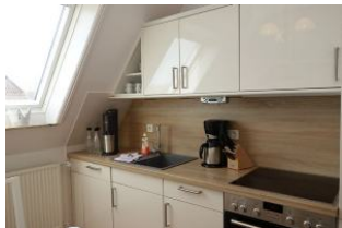
Die Küchenzeile in der sep. Küche