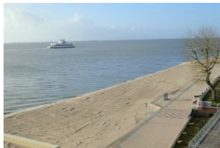
Der Blick von Balkon auf die Nordsee