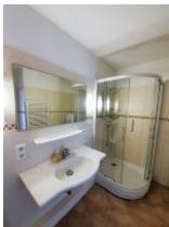
Das geräumige Duschbad verfügt auch über Waschmaschine und Trockner.