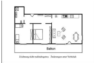
Der Grundriss der Wohnung