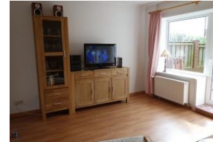
Grosses Fenster und Tür zur Terrasse