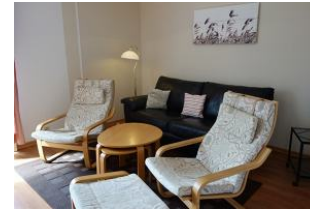
Das Wohnzimmer mit Couch und gemütlichen Sesseln.