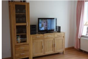
Die Technik darf natürlich auch nicht fehlen....