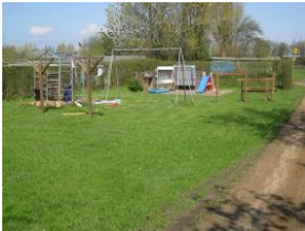
Der Spielplatz auf dem Grundstück, dahinter befindet sich der Parkplatz.