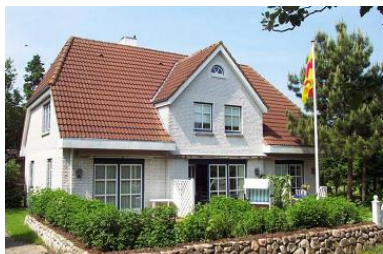
Das gemütliche Mittelhaus in Nieblum, Gartenstraße 12

Die Unterkunft verteilt sich über EG und 1.OG.