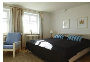
Das helle behagliche Schlafzimmer mit Doppelbett (180x200 cm), zwei Sesseln und einer kleinen Schreibablage.