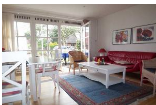
Das gemütliche Wohnzimmer mit Esstisch und Kamin ist hell gestaltet. LCD-Sat-TV mit DVD-Spieler und WLAN gehören zur Ausstattung.

Das Haus für Nichtraucher zeichnet sich durch die besonders ruhige Lage am Rand des alten Dorfkerns aus. Zum Nieblumer Strand sind es ca. nur 700 m. Das Mittelhaus bietet Platz für 4 Pers. + max. 1 Kleinstkind im Kinderreisebett und wurde kinderfreundlich eingerichtet. Im hellen Wohnraum mit Esstisch sitzt man gemütlich vor einem offenen Kamin. Ein PKW-Stellplatz befindet sich auf dem Grundstück.