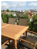
Terrasse mit Garten