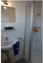
...Spiegel, Ablagefläche und ...