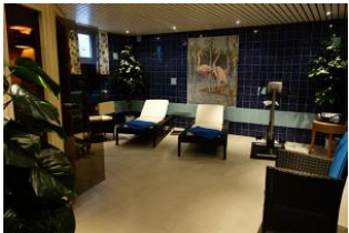
Der Fitnessbereich im Untergeschoß mit ...