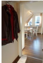
Der kleine Flur mit Garderobe