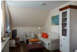
Eine gemütliche Wohncke mit TV Gerät