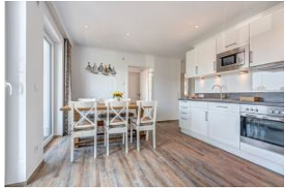
Essplatz und Küche