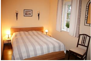
Dieses gemütliche Schlafzimmer lädt zum ruhevollen Schlafen ein,