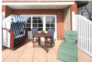
... auf Ihre eigene Südterrasse mit Strandkorb.