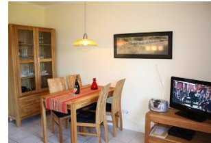
Die Essecke im Wohnzimmer bietet reichlich Platz für 4 Personen.