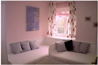
Kinderschlafzimmer; Größe der Einzelbetten 80/190 und 80/180. Liebevoll zum Träumen für Sie hergerichtet.

Entfernungen, zirka: zum Bäcker 1,5 km, zur Einkaufsmöglichkeit 2,0 km, zum Flugplatz 1,0 km, zum Golfplatz 900 m, zum Hafen 3,0 km, zum Meer 50 m, zum Badstrand 50 m, zum Ortszentrum 3,0 km