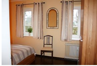
ein großer Schrank für das Urlaubsgepäck ist vorhanden.