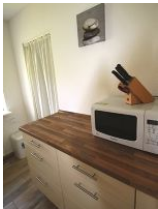
... mit moderner Mikrowelle und viel Platz.