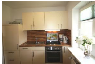
Auch das Kochen macht Spaß in der neuen, hellen und freundlichen Küche...