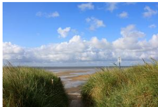
Der direkte Strandzugang ist keine 100 Schritte entfernt.