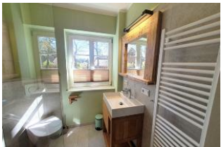
Das Badezimmer wurde 2022 frisch renoviert.