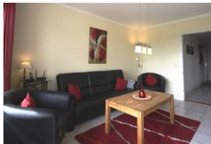
Das gemütliche Wohnzimmer mit direktem Ausgang ...