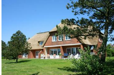
Die Unterkunft befindet sich im EG.

Traumhafte Lage, die begeistern wird: In diesem friesischen Reetdachhaus, nur wenige Schritte vom Meer entfernt, befindet sich diese ruhige Wohnung in Endlage.