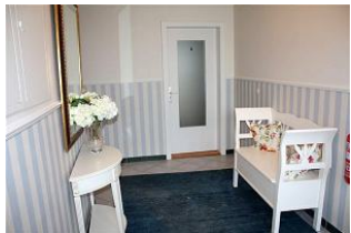
Einen ausgesprochen noblen ersten Eindruck vermittelt das Entrée.

In unmittelbarer Strandnähe, windgeschützt im idyllischen Bredland gelegen, unweit von Wyk und neben dem Golfplatz, verbringen Sie Ihren Urlaub ganz im Sinne "Föhr leben". Bei dieser liebevoll eingerichteten Erdgeschosswohnung, den herrlichen Strand vor der Tür, der selbst in der Saison nicht überfüllt ist, atmen Sie Meeresluft sobald Sie die Tür öffnen. Bredland besteht ausschließlich aus reetgedeckten Häusern. Lichtdurchflutet, hochwertig und geschmackvoll eingerichtet, mit Parkett in den Schlafzimmern, einer neuen Küche, großzügigem Tageslichtbad und einem urgemütlichem Wohnzimmer, von dem Sie direkt auf Ihre eigene teilüberdachte Südterrasse gehen, die in eine weitläufige Liegewiese zur Meeresseite übergeht, garantiert Ihnen Erholung und Entspannung nach einem erlebnisreichen Urlaubstag.