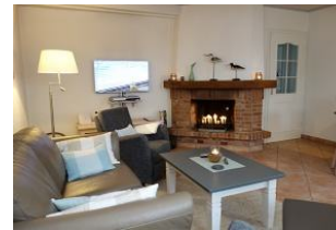
Couch und zwei Sessel. Kamin und TV Gerät. Es wird Ihnen an nichts fehlen für einen gemütlichen Abend