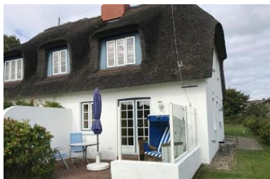
Die Unterkunft verteilt sich über EG und 1.OG.

Das Reetdachhausteil liegt in exponierter ruhig Lage, in einer Sackgasse, mit einem grossen Garten können Sie hier relaxen und entspannen und sie haben einen unverbauten Blick in einer aussergewöhnliche Lage mit Deichblick. Das gemütliche Haus besteht aus einem Wohnzimmer mit Kamin und direktem Zugang zum Garten mit Strandkorb, die Küche ist sehr gut ausgestattete mit Mikrowelle, Geschirrspüler und allem was man benötigt, im Erdgeschoss gehen sie auf warme Terracottafliesen Ein Badezimmer mit Dusche befindet sich im Erdgeschoss und das zweite Badezimmer mit Badewanne und Doppelwaschtisch, Bidet im 1 OG. Im 1 OG haben Sie zwei Schlafzimmer mit jeweils einem 1,60 Bett für 2 Pers. Im 2. OG haben Sie einen kleinen Ruheraum als Rückzugsort.