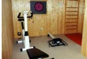
Der kleine Fitnessraum im Keller des Hauses.