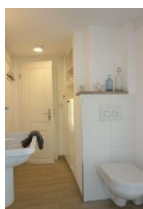
...Toilette und Einbauschränk