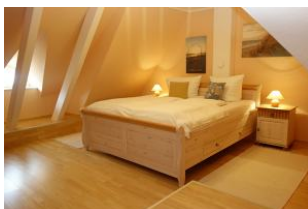
Ein weiteres Schlafzimmer mit Doppelbett (180x200cm)