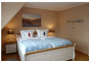
....noch einmal das Bett.