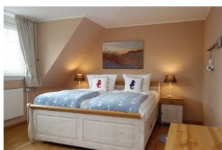
Das Elternschlafzimmer mit großem Doppelbett (180x200cm)