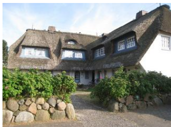
Das Eckhus im Hochstieg 22

Die Unterkunft verteilt sich über EG, 1.OG und DG.