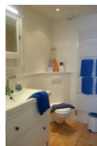
Das Badezimmer im Obergeschoß mit.....