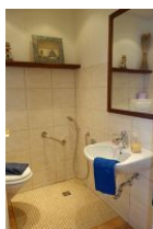
Das Gäste - WC im Erdgeschoß mit "Fusswaschstelle"