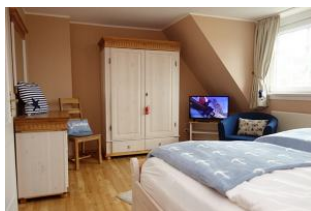
....zur Entspannung noch ein wenig fernsehen ?