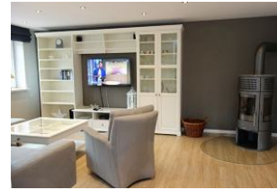
Herrlich ....ein Ofen. Holz gibts im REWE-Markt