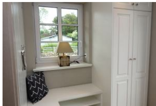
Treten Sie ein, ein kleiner Flur mit Sitzbank erwartet Sie...