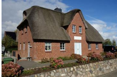
Das Doppelhaus "Golfoase"

Die Unterkunft verteilt sich über EG, 1.OG und DG.