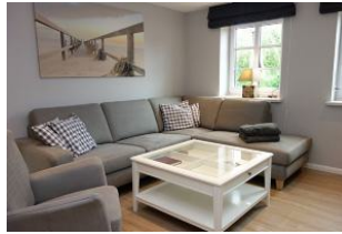
Die große Couch hat für alle ein Plätzchen