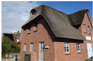
Der linke Eingang führt in das Haus 2

Im idyllischen Dorf Oevenum finden Sie das Doppelhaus "Golfoase" Zwei großzügige Doppelhaushälften für jeweils 6 Personen erwarten Sie. Ein gemütliches Wohnzimmer mit offener Küche und familientauglichem Essplatz. Austritt in den Garten und zur möblierten Terrasse. Ein großes Duschbad mit Waschmaschine und Trockner. Im Obergeschoß die Schlafräume und ein weiteres Bad mit Dusche und Badewanne. Hier ist an alles gedacht, hier kann man sich wohlfühlen, hier wird es Ihnen einfach nur gut gehen, und das Beste....hier darf auch Ihr Vierbeiner dabei sein.