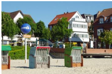
Das Haus Mittelstr.2/Ecke Sandwall