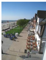
Der Blick auf den neu gestalteten Sandwall

In diesem, fast 100 Jahre alten Stadthaus wohnt man wirklich "mittendrin". Auf der geschlossenen Veranda, die Wind und Wetter abhält, den Blick auf die Promenade aber freigibt, könnte man den ganzen Tag verbringen. Den Menschen zusehen, entfernt die "Kurmusik" hören, aufs Meer schauen - eben einfach die Seele baumeln lassen. Das ist Erholung pur. Die modern eingerichtete Wohnung mit dem Charme alter Gemäuer liegt im 2.OG des Hauses und bietet 2 Personen ausreichend Platz für einen erholsamen Urlaub. Aber Achtung: dies alte Haus hat auch alte Treppen. Lang, steil und kurze Stufen. Allein vom Hauseingang in die 1.Etage müssen Sie 17 Stufen bewältigen.