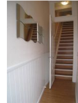
Die lange Treppe (17 Stufen) vom Hauseingang zur 1.Etage