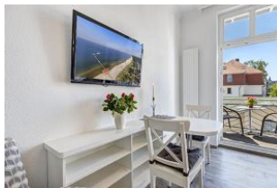
Essbereich mit Blick zum Balkon