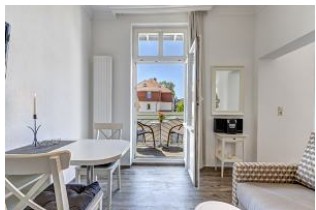
Wohnbereich mit Blick zum Balkon