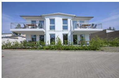
Hausansicht Neubau Villa Margarete