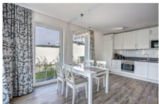
Essplatz und Küche