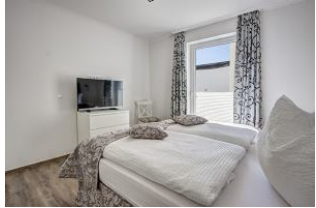
Schlafzimmer mit Flachbild TV