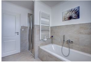
Bad mit Wanne und Dusche