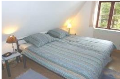
Das gemütliche Elternschlafzimmer mit großem Doppelbett (200 x 200 cm)