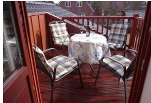
... lädt zu gemeinsamen Stunden ein.