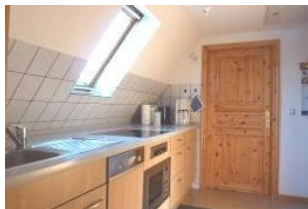
Ihre voll ausgestattete Küche lässt keine Wünsche offen.