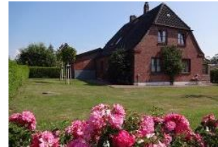
Ein großer Garten lädt zum Entspannen ein.