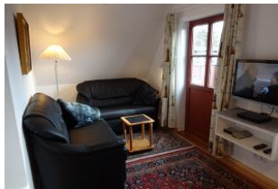
Ihre gemütliche Sitzcke.