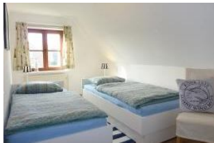
Das zweite Schlafzimmer mit getrennten Betten, z.B. für die Kinder.

Für preisbewusste Familien mit bis zu 2 Kindern ist diese Wohnung besonders geeignet. Bereits morgens scheint die Sonne ins Wohnzimmer und begrüßt die Gäste zum Frühstück am Esstisch. Abends lädt eine Sitzcke mit einem Sofa und zwei Sesseln zum Spielen oder Fernsehen ein.