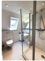
Das helle Duschbad bietet genügend Platz für die ganze Familie.