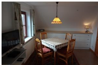
Ihr heller Sitzplatz.