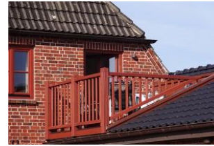
Der gemütliche Balkon ...