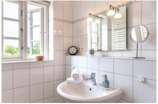
Badezimmer im OG mit Dusche