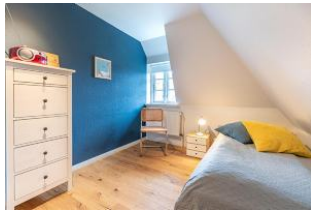
Schlafzimmer mit Einzelbett