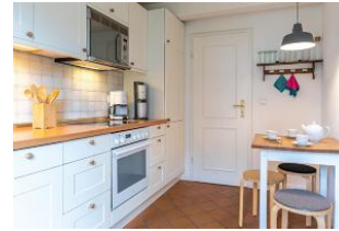
Küche mit Essbereich