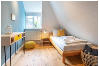
Schlafzimmer mit Einzelbett