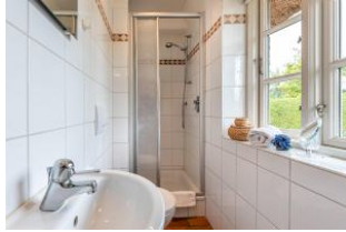
Bad im EG