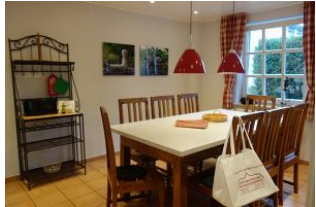
Herrlich - eine sep. Küche....