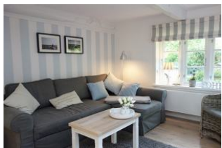
...die bequeme Couch...