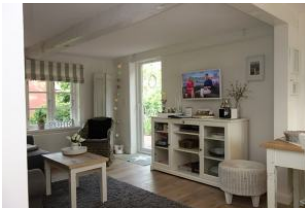
Blick ins Wohn-/Esszimmer