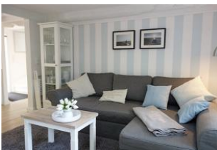
...von der anderen Seite.