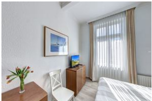
Schlafzimmer 1 mit Zugang zum Balkon