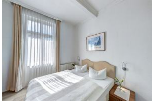
Schlafzimmer 1 mit Zugang zum Balkon