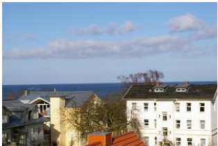
Seeblick Ostseewarte Nr. 17