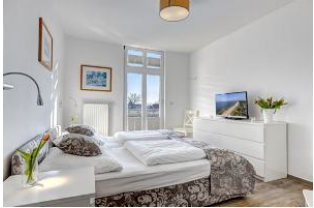
Schlafzimmer mit Zugang zum Balkon