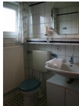
Das Badezimmer mit Dusche.