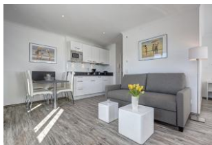
Essplatz und Küchenzeile