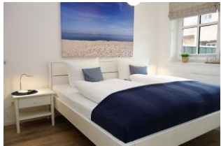
Großes Doppelbett im Elternschlafzimmer 180x200cm