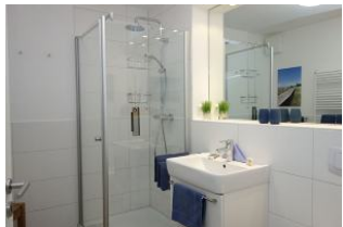
Das Duschbad, Handwaschbecken, nicht im Bild, die Toilette