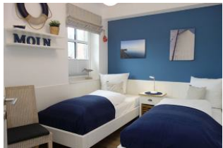
Das Kinderschlafzimmer mit 2 Einzelbetten