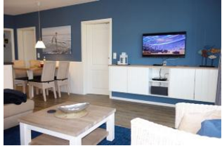
TV Gerät und Blick zum Esstisch