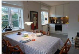
Esstisch und der Blick zur Küche