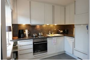
die offene Küche hat alles, was man so braucht.