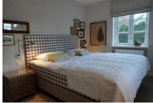
Großes Doppelbett im Schlafzimmer ohne Fußteil 180x200cm