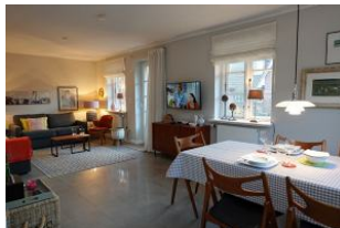
...der Blick vom Esstisch zum Wohnbereich