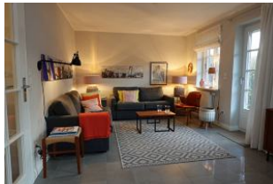
...in diesem Wohnbereich muss man sich einfach wohlfühlen...