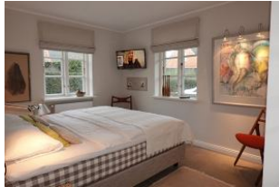
...wer mag, kann auch auch vom Bett aus fernsehen....