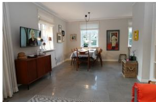
...der Blick zum Essbereich