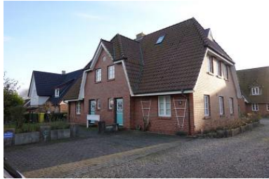
Das Haus Rungholtstr. 3b Die Wohnung Hanneke befindet sich rechts im EG