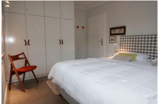
Der Einbauschränk für Kofferinhalte bietet genügend Platz