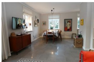
...der Blick zum Essbereich