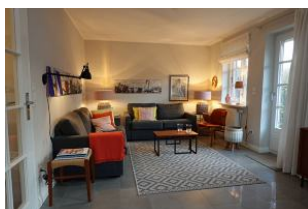
...in diesem Wohnbereich muss man sich einfach wohlfühlen...