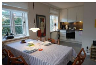
Esstisch und der Blick zur Küche