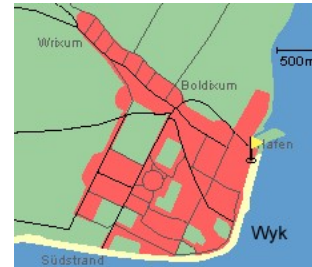
Entfernungen, zirka: zum Bäcker 25 m, zur Einkaufsmöglichkeit 25 m, zum Flugplatz 3,0 km, zum Golfplatz 3,0 km, zum Hafen 50 m, zum Meer 2 m, zum Badstrand 2 m, zum Ortszentrum 0 m