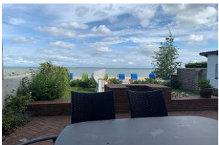
Die überdachte Terrasse ist möbliert.