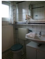
Das Badezimmer mit Dusche.