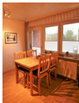
... gemütlicher Essecke bietet reichlich Platz für 4 Personen.