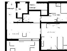
Der Grundriss der Wohnung.