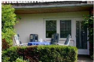
Die gemütliche und geschützte Terrasse lädt zum Kaffee und Kuchen essen ein.

Das Haus "Pidder Lyng"- gelegen in Utersum - bietet Ihnen alles, was Sie sich für einen erholsamen Urlaub wünschen können. Das Dorfzentrum befindet sich nur 800 Meter entfernt und der schönste Strand der Insel ist in wenigen Gehminuten erreichbar. Die stilvoll eingerichtete, gemütliche Ferienwohnung im Erdgeschoss besitzt zudem eine eigene Terrasse und bietet Ihnen mit zwei Schlafräumen, einem großen Wohnzimmer mit integrierter Essecke, einer separaten Küche und einem Duschbad genügend Platz für bis zu vier Personen. Die hochwertige Ausstattung lässt keine Wünsche offen.