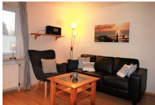
Der große und gemütliche Wohnraum mit Fernsehecke und ....