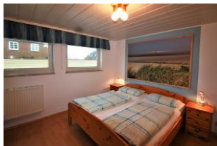
Schlafzimmer mit Doppelbett.