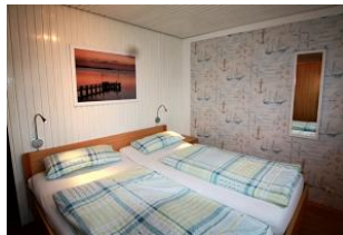
Der zweite Schlafraum im maritimen Look.