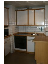
Die separate Küche ist ausgestattet mit Backofen, Geschirrspüler und Mikrowelle.