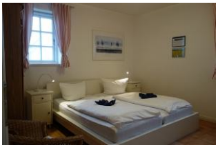
Ein Schlafzimmer mit Doppelbett 180x200cm