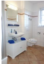
Handwaschbecken, Ablage, Toilette