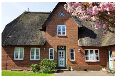
Haus Faltings in ruhiger Lage im Ortsteil Goting mit 3 Wohneinheiten