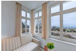
Blick aus Veranda