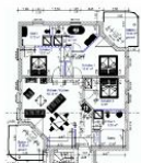
Wohnungsgrundriss (Möblierung exemplarisch)

STRANDNAH, GROSS, MODERN! Mit 2 BALKONEN (je ca. 11 qm), FAHRSTUHL, SAUNA und nur ca. 100 m zur STRANDPROMENADE! Großzügige elegante 4 - Zimmer - Wohnung mit sehr guter Ausstattung! 3 separate Schlafzimmer, 3 Bäder (2 davon ensuite), alle mit Fußbodenheizung. Die ensuite-Bäder verfügen über Wanne und Dusche bzw. Dusche. Das dritte Bad ist ein Saunabad mit Saunakabine und Schwalldusche. Der große Wohnbereich verfügt über eine vollausgestattete Küchenzeile, einen Eßbereich und einen Couchbereich mit KAMINOFEN. Die Balkone sind möbliert. Zur Wohnung gehört ein STRANDKORB AM STRAND. Die Wohnung verfügt über einen Pkw-Stellplatz in der teilüberdachten Tiefgarage. Fahrradabstellfläche ist vorhanden. Vom Haus aus können Sie das Ortszentrum und die bekannte Ahlbecker Seebücke in ca. 2 Minuten zu Fuß erreichen.