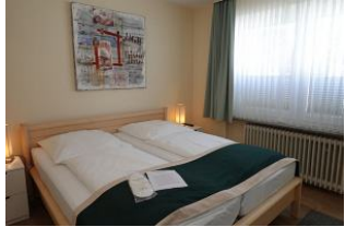
Das große Bett misst 180x200cm