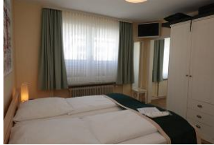
im Schlafzimmer ein großes Fenster und ein zus. TV Gerät