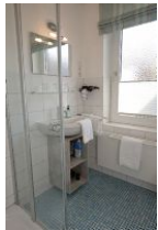
Das Bad mit Handwaschbecken und ...